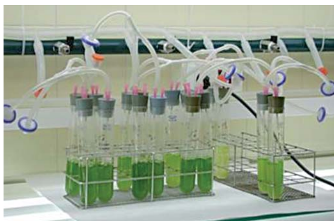
Cultivos de la microalga dulceacuícola Chlorella vulgaris .

En nuestros proyectos en fase de desarrollo, pretendemos abordar la utilización de las microalgas en la detección y monitorización de diferentes contaminantes frecuentes en los sistemas dulceacuícolas (metales, pesticidas y fármacos), aplicando técnicas citómicas puestas a punto en nuestro laboratorio y que permiten detectar la respuesta rápida de estos microorganismos a distintos niveles celulares (viabilidad celular, potencial de membrana citoplasmático y mitocondrial, pH intracelular, calcio intracelular libre, nivel de