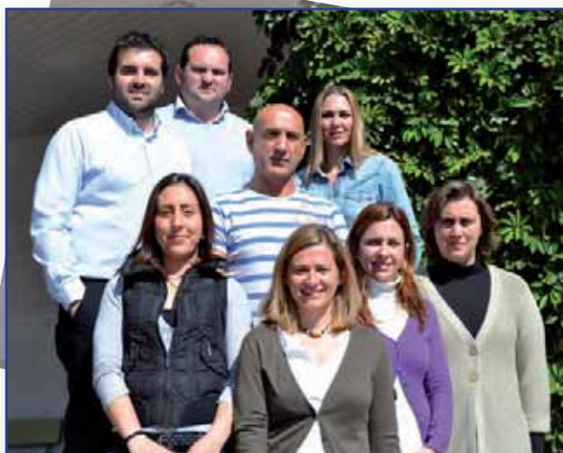
El grupo de Microbiología Molecular y Biotecnología de Hongos de la Universidad de Cádiz.

Nuestro grupo comenzó su actividad investigadora con el estudio del hongo Botrytis cinerea , y posteriormente con Colletotrichum acutatum y C. gloeosporioides . Ambos géneros han sido catalogados según la revista Molecular Plant Pathology , entre los 10 hongos más peligrosos por las pérdidas que ocasionan en agricultura. Nuestros estudios se han centrado principalmente en los cultivos de fresa, tomate y vid, dada la importancia económica de estos cultivos en nuestra región. La investigación desarrollada ha sido financiada por proyectos de investigación europeos, nacionales y autonómicos, y por la colaboración con empresas del sector agroalimentario.