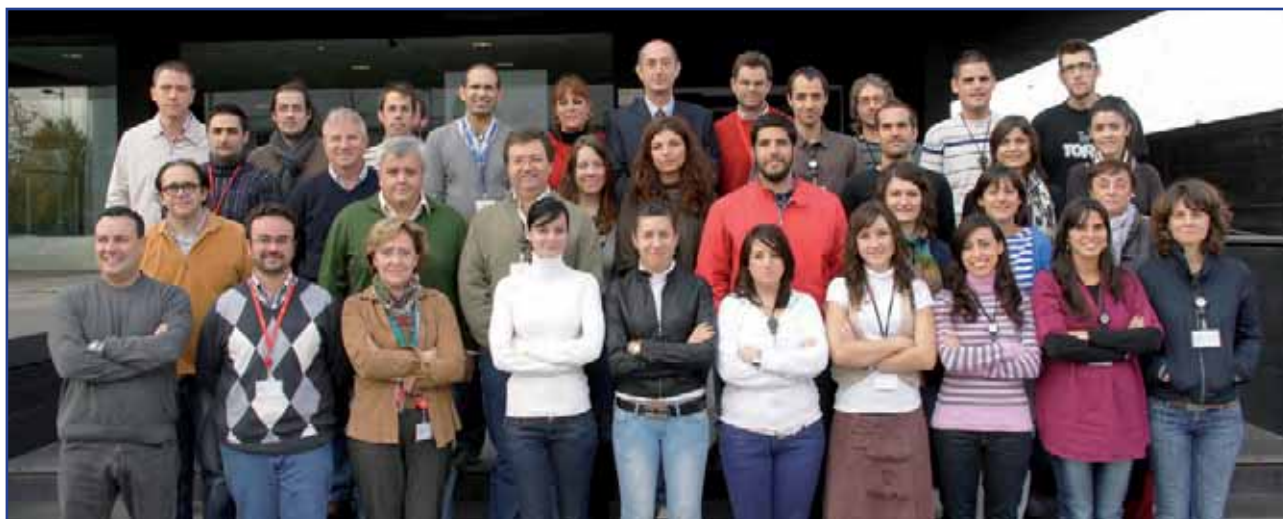
Miembros del grupo de la Fundación MEDINA.

investigación Básica de Merck Sharp & Dohme de España (CIBEMSD) en Madrid. El equipo actual de MEDINA procede en su gran parte de uno de los más antiguos Programas de Descubrimiento de fármacos a partir de productos naturales de la industria farmacéutica y que durante sus más de 50 años de existencia dentro la división de investigación de Merck (Merck Research Laboratories) ha contribuido como uno de los centros con mayor éxito en cuanto al número de productos en el mercado procedentes de sus líneas de investigación.