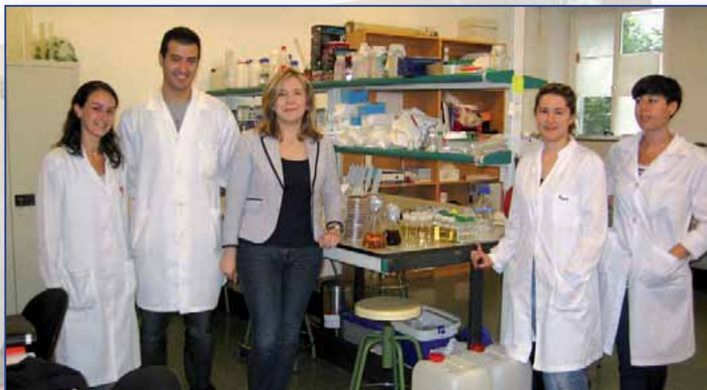
Grupo de Microbiología Industrial y Biotecnología Alimentaria de la Universidad de Vigo.

Mediante estas investigaciones se analizó la posibilidad de utilizar las poligalacturonasas de K. marxianus como alternativa a los preparados pécticos comercializados con distintos fines. Los resultados demostraron la eficacia de la enzima producida por esta levadura para llevar a cabo la clarificación de zumos de frutas, incluyendo el mosto utilizado para las fermentaciones vínicas y, sobre todo, su excelente comportamiento para favorecer la extracción de precursores y potenciar de forma diferenciada, dependiendo de las concentraciones y condiciones de uso, el perfil aromático de los vinos. En la misma línea se demostró, igualmente, la idoneidad de esta enzima para incrementar significativamente el contenido en polifenoles de los vinos obtenidos, así como para intensificar el color en los mismos. La eficacia de la pectinasa de Kluyveromyces en estas aplicaciones resultó comparable a la de preparados que contienen mezclas enzimáticas, evitando los efectos secundarios, no deseables, que estos últimos pueden ocasionar en los productos tratados.