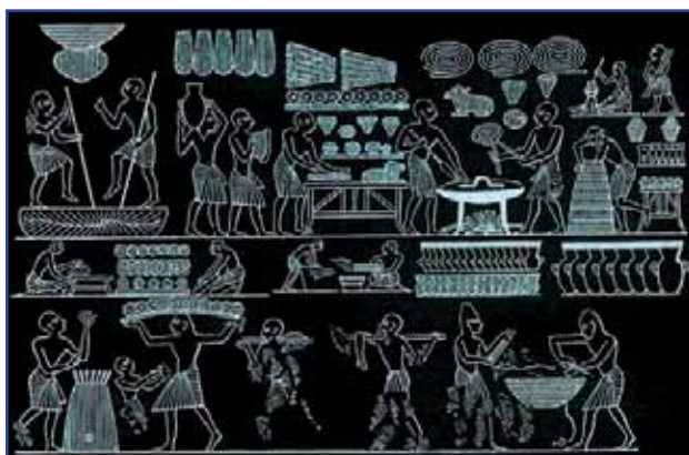
Elaboración de pan en el Antiguo Egipto (bajo imperio, época de Ramsés II).

La Microbiología Industrial nació hace muchos miles de años con las manipulaciones de alimentos que los hombres de edades pretéritas hacían y que habían visto por incontables repeticiones prevenían la putrefacción de los mismos. Evidentemente ellos no sabían lo que ocurría pero sí aprendieron rápidamente a controlar los efectos que los microorganismos presentes en los alimentos ejercían. El capítulo de las bebidas fermentadas constituye un capítulo aparte pues su elaboración estaba ligada a aspectos especialísimos de las diferentes culturas. La cerveza y el vino comenzaron a utilizarse no hace menos de unos 9000 años y entendemos que desde Mesopotamia y Egipto se extendió a toda Eurasia. En este caso la presión selectiva que el hombre ejerció sin saberlo sobre la levadura que conduce los fenómenos fermentativos y que hoy llamamos Saccharomyces cerevisiae fue tal que incluso forzó la aparición de la especie taxonómica como tal.