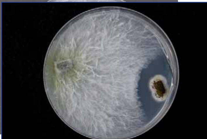
Antagonismo entre especies de endófitos aislados de Retama sphaerocarpa, La Malahá, Granada, España.