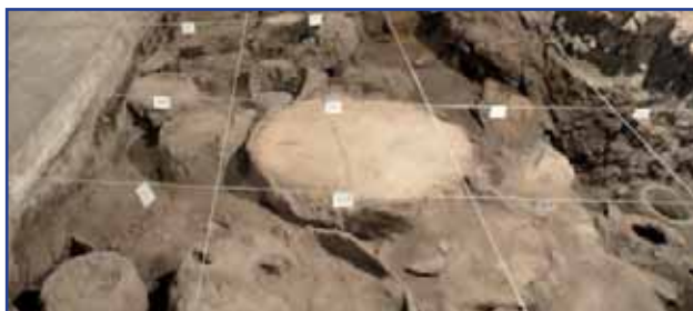
La arqueología revela la actividad biotecnológica empírica del hombre en la antigüedad.

No cabe duda que todo lo que rodea al vino tiende a tener una gran trascendencia y no solamente por razones culturales o religiosas, sino simplemente por razones económicas ya que solamente hay una cosecha de uvas al año y si se estropeaba el caldo (o se estropea) la trascendencia a la sociedad era alta. No ocurría así con la cerveza (bebida fermentada surgida al tiempo que el vino) ya que podía prepararse en cualquier momento si se disponía de un cereal libre de aflatoxinas que pudiese germinar e iniciar así la producción de lo que con el devenir de los siglos se vino en denominar como «mosto cervecero». También en este tipo de bebida participan estirpes especiales de S. cerevisiae que de nuevo han sido seleccionadas por el hombre a lo largo de milenios y similares PERO diferentes de las que participan en la elaboración del vino; en este caso muchas veces resultan ser estirpes heterotálicas mientras que la mayoría de las vnicas resultan ser homotálicas. La trascendencia de esta aparentemente pequeña diferencia es, sin embargo, alta, como bien conocen todas aquellas personas que hayan trabajado con ellas. Estas pocas líneas sobre el vino que he plasmado aquí han delimitado (hoy todavía) un campo biotecnológico muy activo pues define un punto de encuentro para fisiólogos vegetales, genéticos (de plantas y levaduras), microbiólogos, bioquímicos y tecnólogos de alimentos.