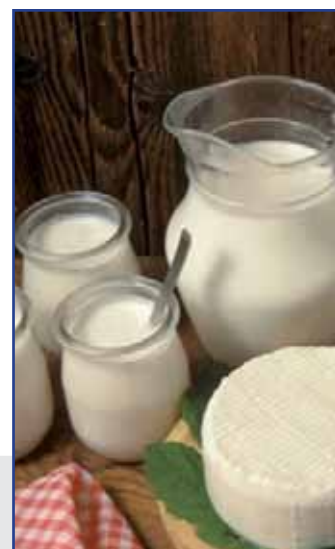
Diversos productos lácteos fermentados.

Un descubrimiento clave inició el cambio dramático que conocemos hoy como ingeniería genética o ADN recombinante: en 1970 Hamilton Smith y Daniel Nathans descubren una enzima (restrictrasa) capaz de reconocer y cortar el ADN en secuencias específicas, que les valió el