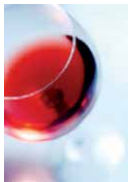
Oenococcus oeni , la bacteria láctica del vino, y la fermentación maloláctica.

que también suponen mejoras organolépticas, y la estabilización microbiológica del vino, al haberse consumido durante la FML los restos de compuestos como azúcares, que podrían provocar contaminaciones posteriores en botella.