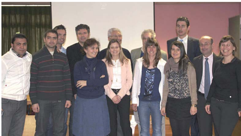
Sección de Lugo

Nuestro grupo comenzó su andadura hace más de 30 años. El grupo de investigación posee amplia experiencia en clonación y explotación de genes con potencial indus-