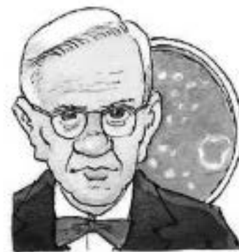
Premio Fleming 2016

¡Nuestra más sincera enhorabuena a los ganadores!